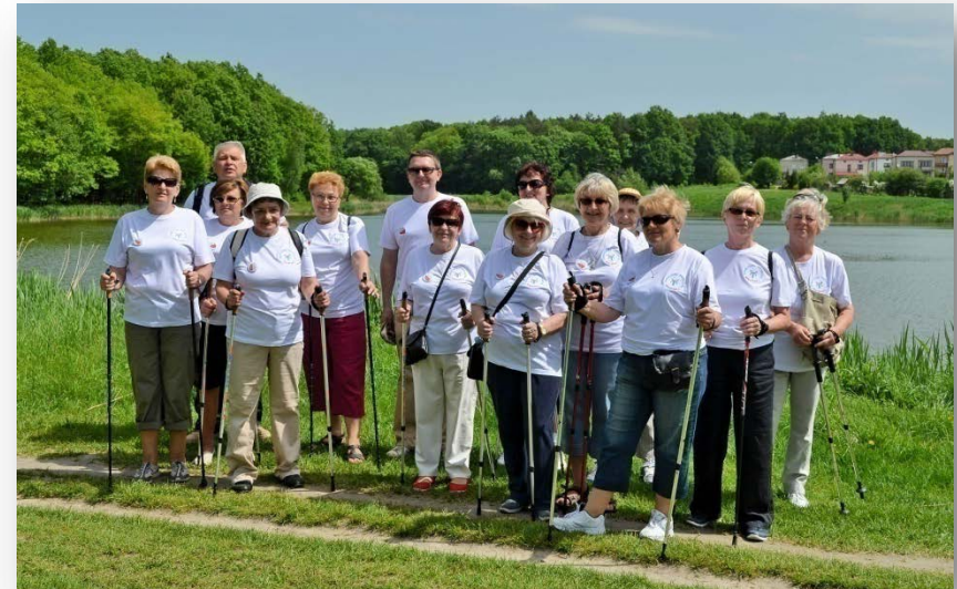
Uczestnicy I Marszu Nordic Walking, Poniatowa 18.05.2013