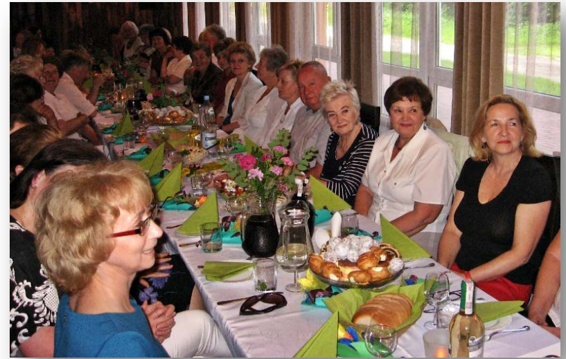
Rada słuchaczy, wykładowcy i studenci PUTW, Poniatowa 13.06.2013