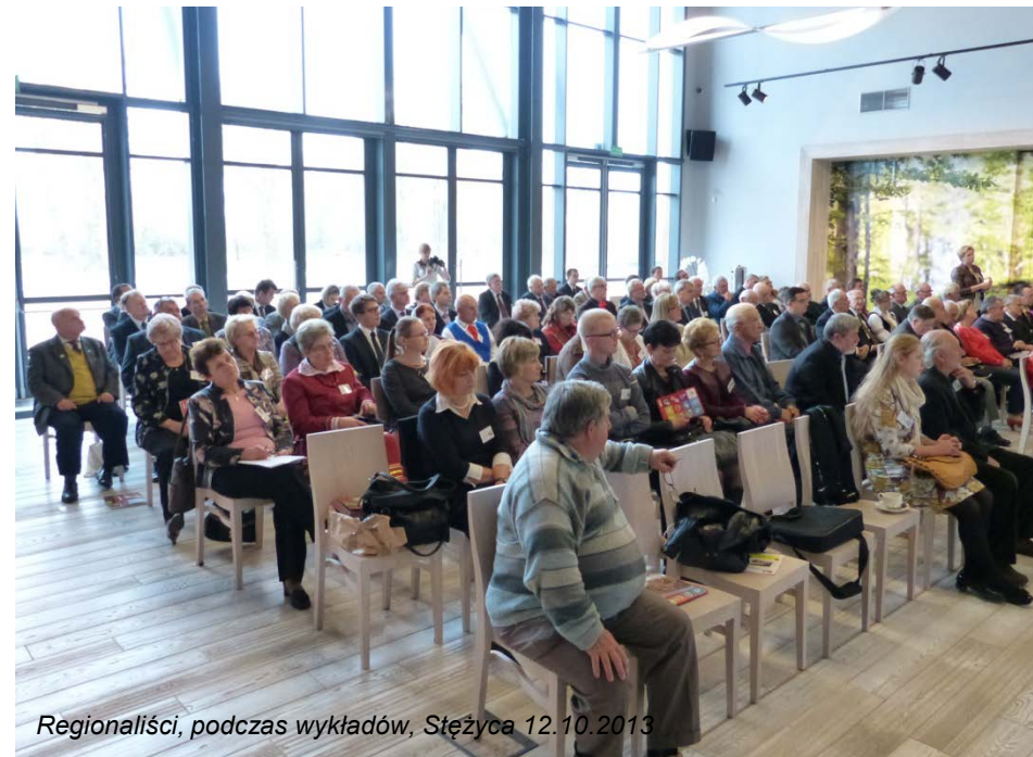
Regionaliści, podczas wykładów, Stężyca 12.10.2013