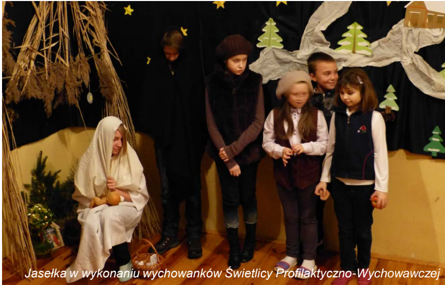
Jasełka w wykonaniu wychowanków Świetlicy Profilaktyczno-Wychowawczej