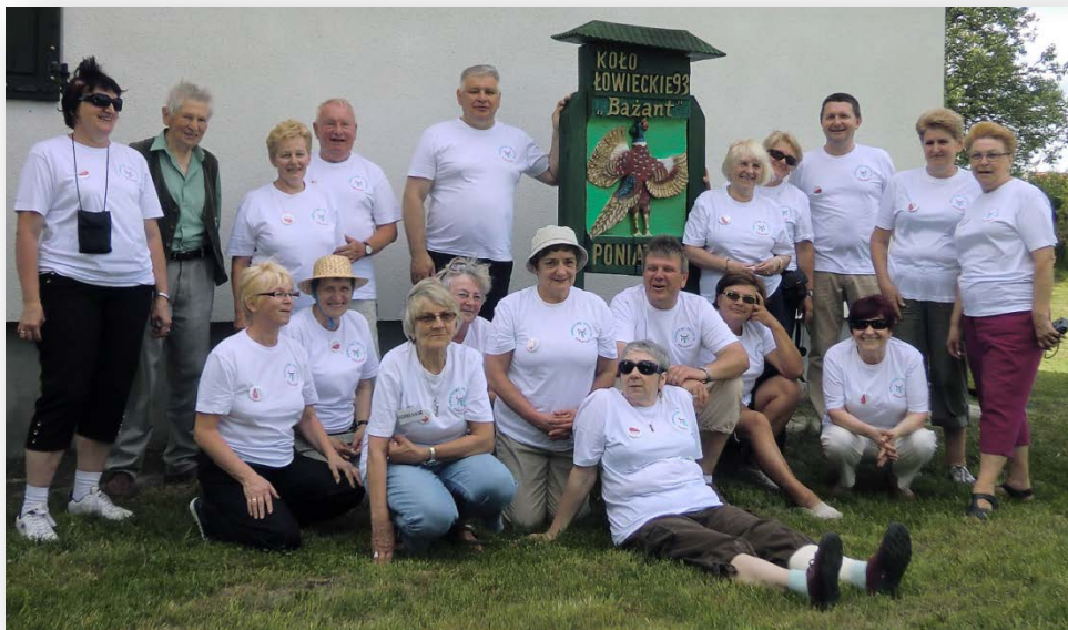
Uczestnicy I Marszu Nordic Walking, Poniatowa 18.05.2013