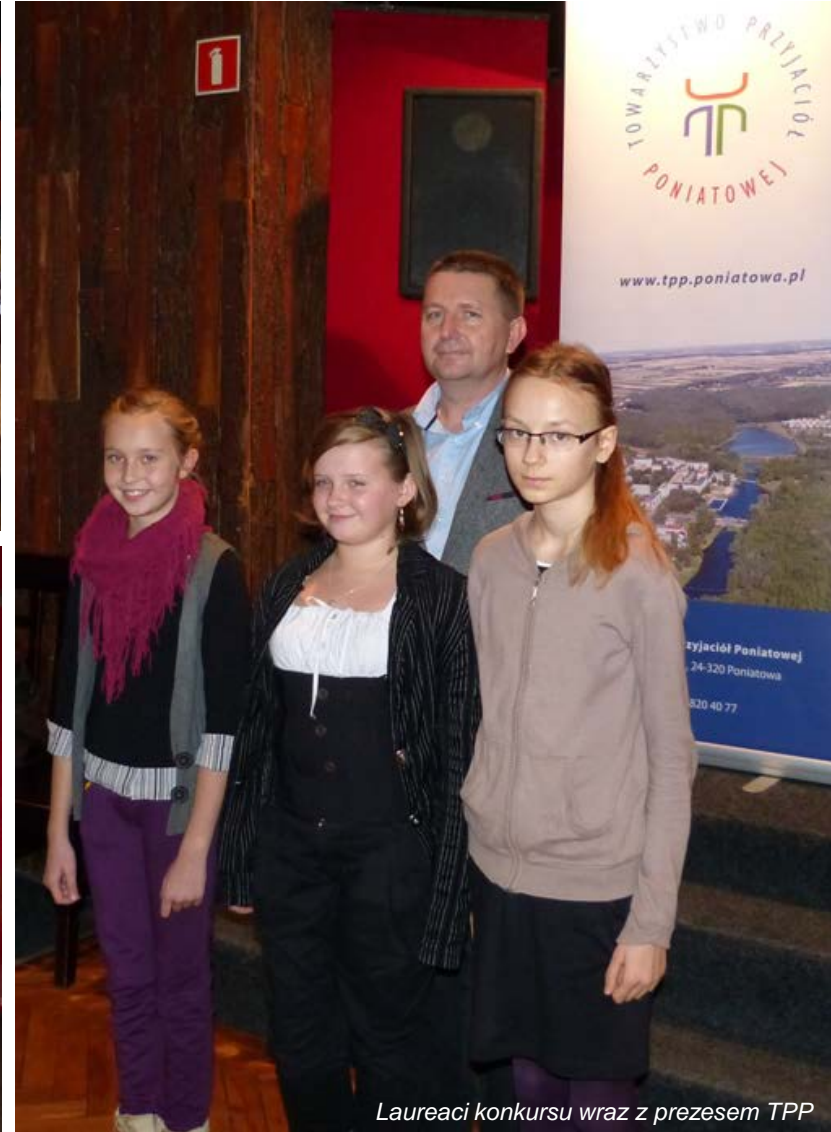
Laureaci konkursu wraz z prezesem TPP