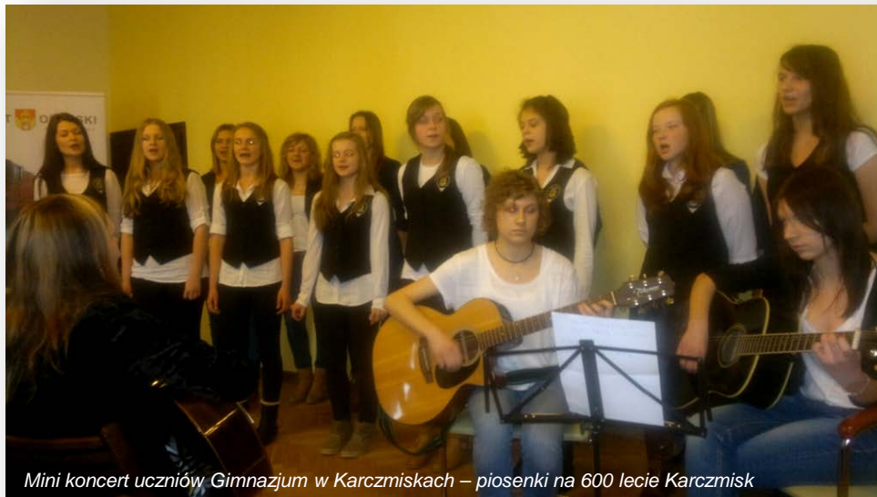
Mini koncert uczniów Gimnazjum w Karczmiskach – piosenki na 600 lecie Karczmisk