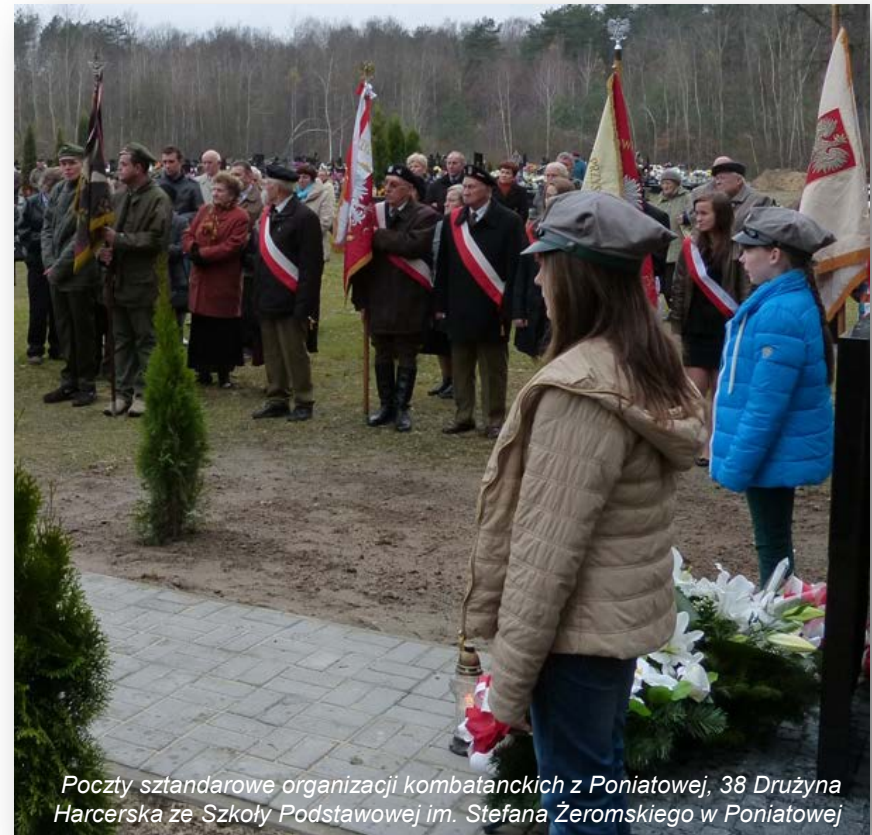
Poczty sztandarowe organizacji kombatanckich z Poniatowej, 38 Drużyna Harcerska ze Szkoły Podstawowej im. Stefana Żeromskiego w Poniatowej