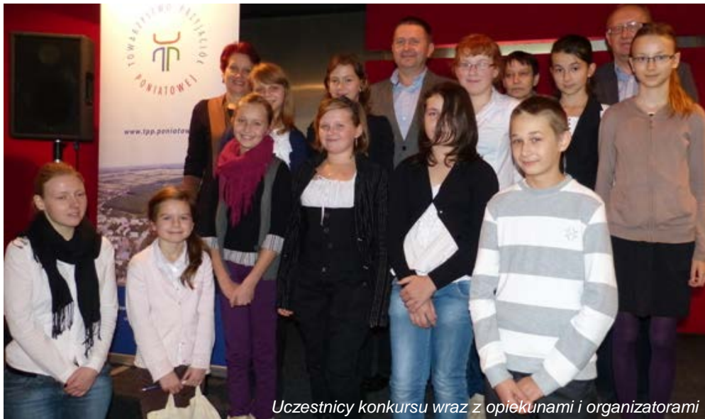
Uczestnicy konkursu wraz z opiekunami i organizatorami