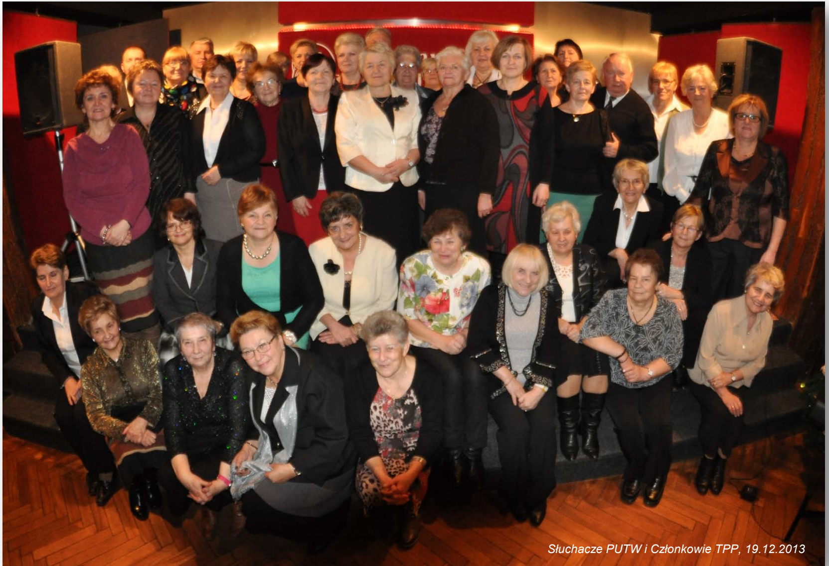
Słuchacze PUTW i Członkowie TPP, 19.12.2013