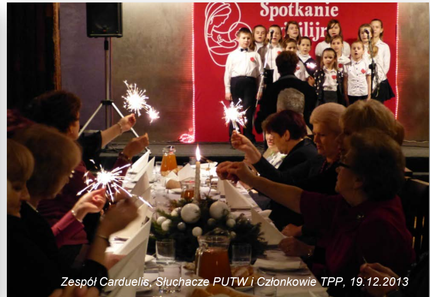
Zespół Carduelis, Słuchacze PUTW i Członkowie TPP, 19.12.2013