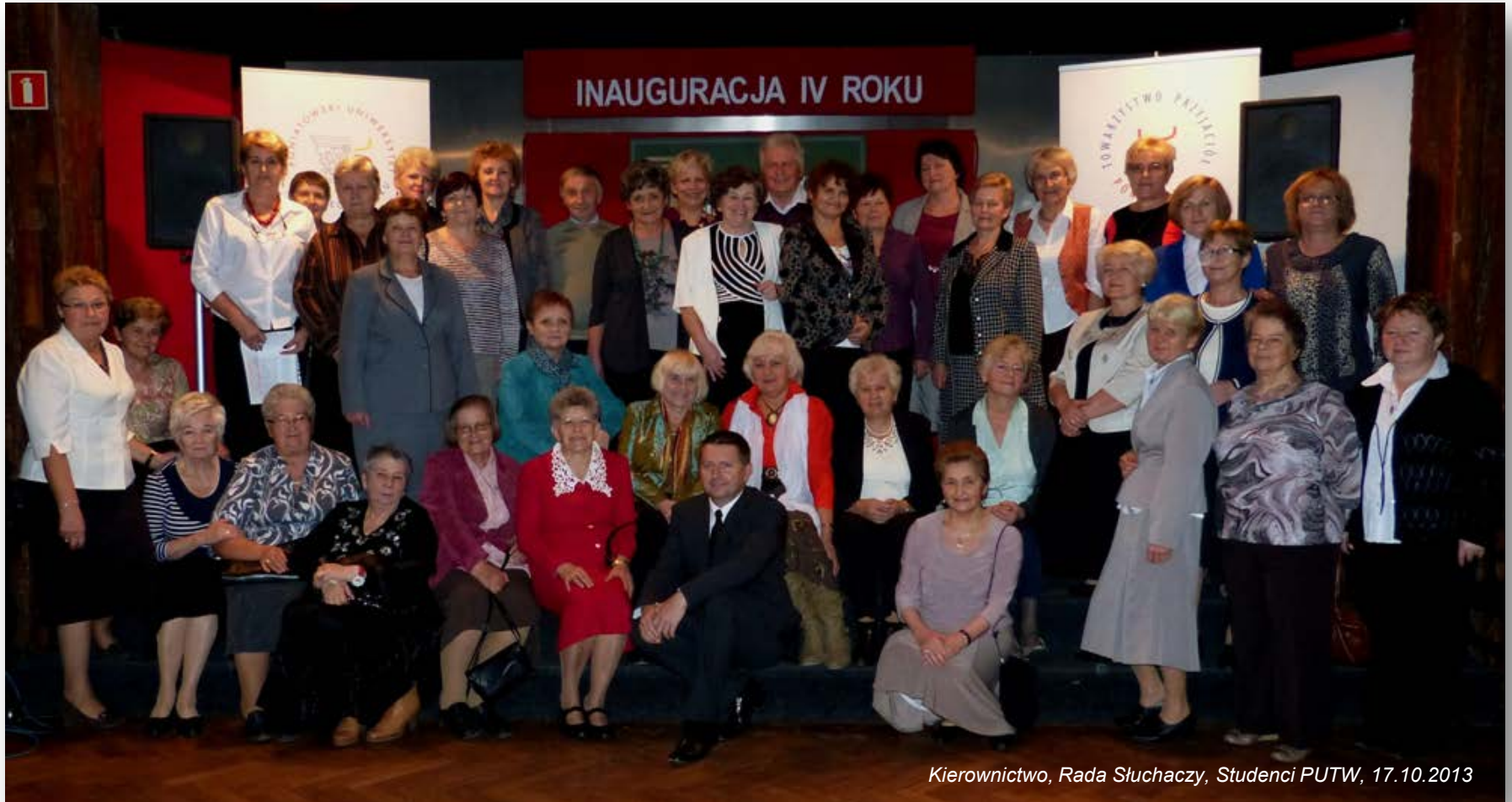
Kierownictwo, Rada Słuchaczy, Studenci PUTW, 17.10.2013

INAUGURACJA IV ROKU PONIATOWSKIEGO UNIWERSYTETU TRZECIEGO WIEKU 17.10.2013