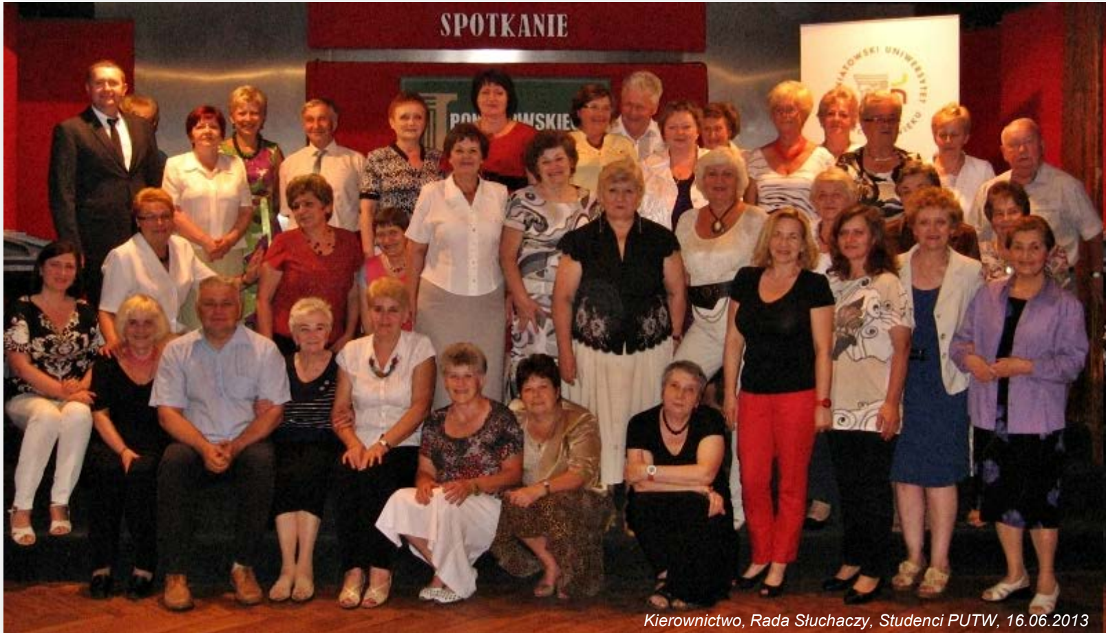
Kierownictwo, Rada Słuchaczy, Studenci PUTW, 16.06.2013