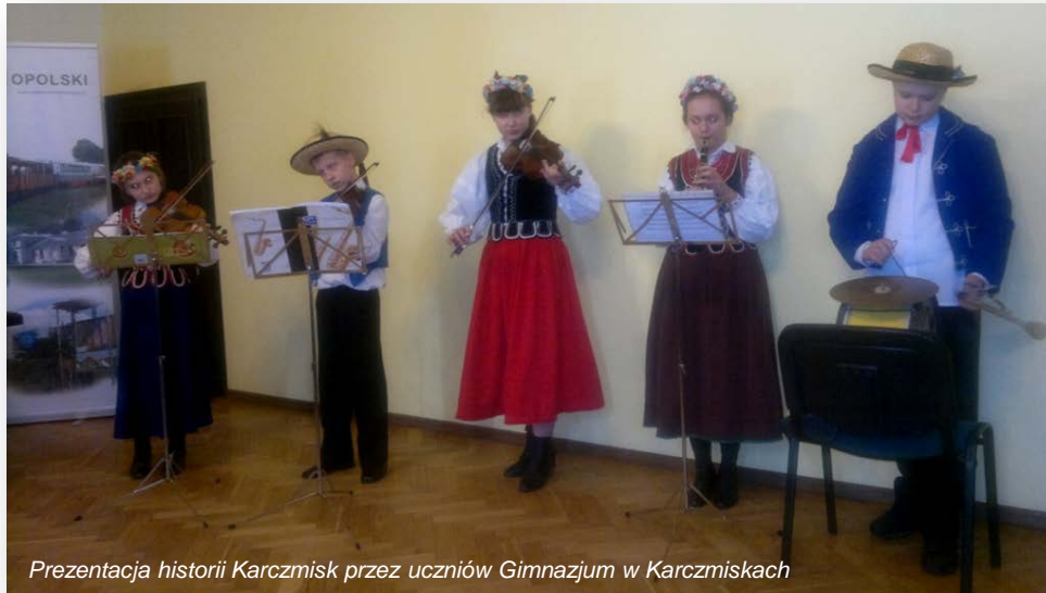
Prezentacja historii Karczmisk przez uczniów Gimnazjum w Karczmiskach