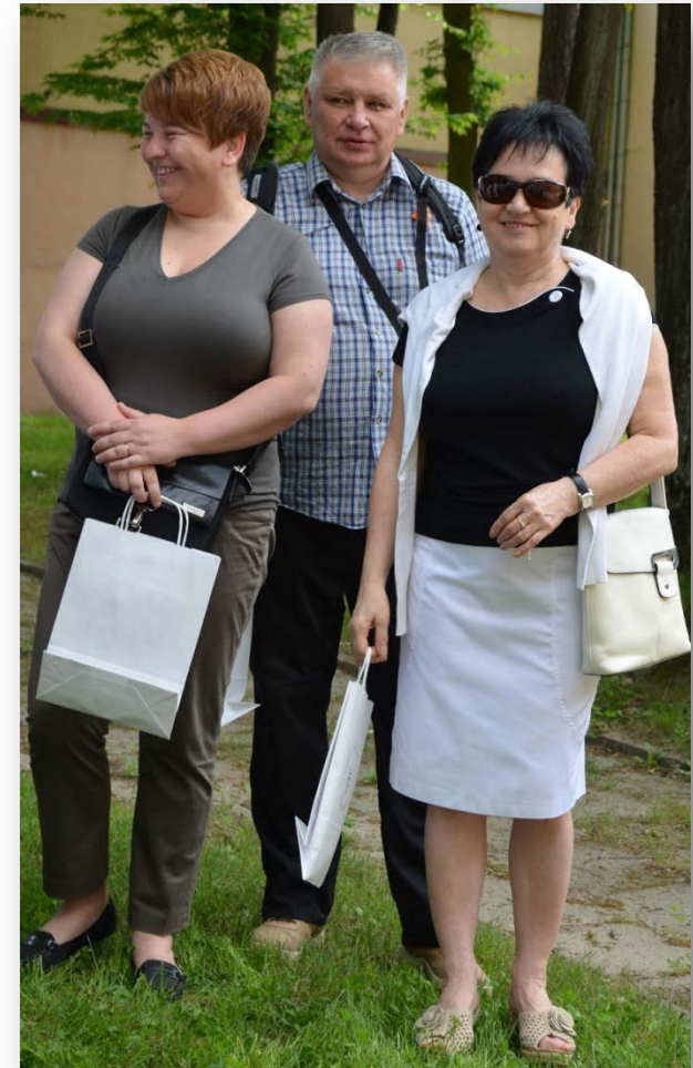
Sponsorzy naszego marszu: Burmistrz Poniatowej, Bank Spółdzielczy w Poniatowej, Przedsiębiorstwo Gospodarki Komunalnej w Poniatowej, firmy: PAWTRANS, WENTWORTH TECH i Bank PKO BP w Poniatowej.