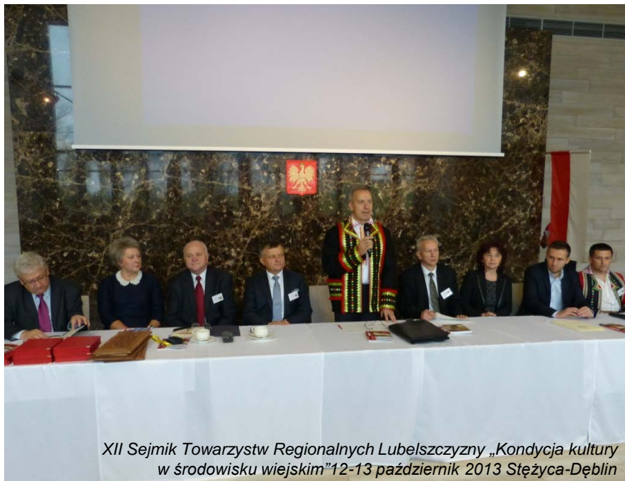
XII Sejmik Towarzystw Regionalnych Lubelszczyzny „Kondycja kultury w środowisku wiejskim” 12-13 październik 2013 Stężyca-Dęblin