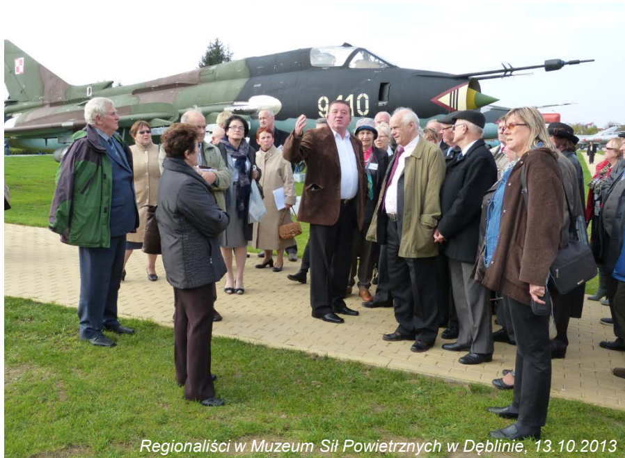
Regionaliści w Muzeum Sił Powietrznych w Dęblinie, 13.10.2013